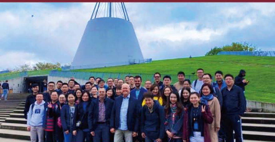
在代大标志性建筑——中央图书馆前合影

剑桥之旅结束后，意犹未尽的我们便搭上前往荷兰的欧洲之星，横穿英吉利海峡海底隧道，一路飞驰，沿途经过法国、比利时，终于来到了闻名遐迩的荷兰首都阿姆斯特丹。在这个被后世称为“海上马车夫”港口城市，诞生了全球第一家证券交易所。我们此行的目的是来考察和学习欧洲在住房节能和可持续发展方面的研究成果和举措经验。